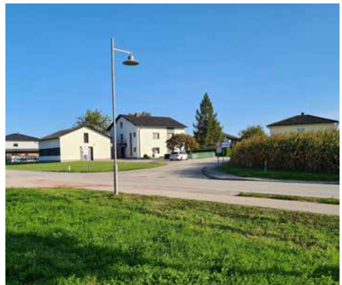
Entschärfung der Siedlungsausfahrt Hofersiedlung vorgezogen