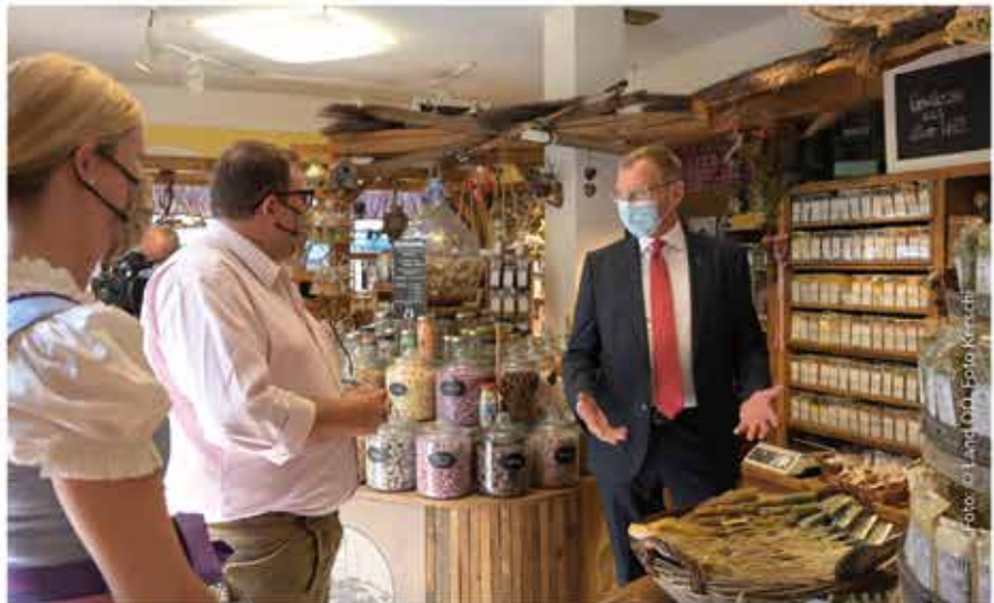
Wir haben in der Krise wieder mehr schätzen gelernt, was wir im eigenen Land haben. Regional einkaufen ist das beste Konjunkturpaket.

„Wir haben in der Corona-Krise wieder mehr schätzen gelernt, was wir im eigenen Land haben: vom Bauernmarkt bis hin zum oberösterreichischen Wirtshaus. Wichtig ist, dass dieses Bewusstsein kein Modetrend für einen Sommer bleibt, sondern ein Dauerzustand wird. Regional einkaufen ist das beste Konjunkturpaket“, betont Landeshauptmann Thomas Stelzer. Wenn nur 20 Prozent mehr heimische Lebensmittel gekauft werden, bringt das rund 46.000 neue Arbeitsplätze in Österreich. So kann jeder dazu beitragen, unser Land wieder stark zu machen.