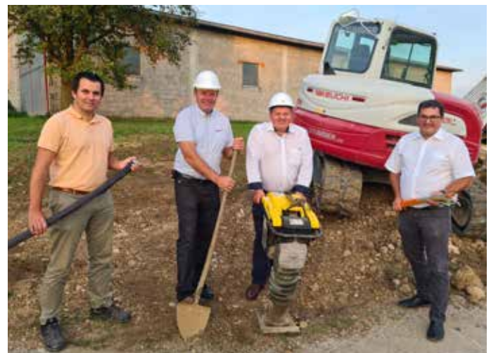
In kürzester Zeit Glasfaserprojekt umgesetzt

Zukunftsort Steinerkirchen an der Traun: Nach einer gewissen Vorlaufzeit und vielen Gesprächen startete nun im September 2020 der Ausbau des Glasfasernetzes in Steinerkirchen und bringt schnelles Internet für unsere Gemeinde. Langes Warten zu Stoßzeiten oder bei aufwendigeren Internetanwendungen gehören in Steinerkirchen so nun bald der Geschichte an. Mit dem neuen Glasfaserinternet, welches von Bund und Land OÖ gefördert wird, wird Steinerkirchen zu 100% in die digitale Welt integriert. Von dem schnellen Internet werden nicht nur Steinerkirchnerinnen und Steinerkirchner beim abendlichen Streaming profitieren – insbesondere für Firmen ist das Glasfasernetz attraktiv, was Steinerkirchen zu einem interessanten Standort für Gründerinnen und Gründer im Zentralraum machen könnte. Gerade die letzten Monate haben uns aber auch gezeigt, wie essenziell eine gute Internetverbindung im Privathaushalt sein kann. Viele Menschen aus Steinerkirchen mussten plötzlich im