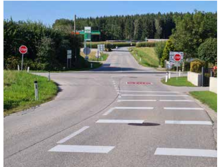
Fahrbahnteiler zur Entschärfung der Linden Kreuzung