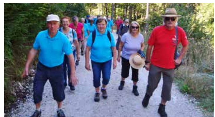
Am 9. September: Fahrt nach Grünau zum Almtalerhaus (Jagersimmerl) von dort wanderten wir rund um die Ödseen und wieder zurück zum Almtalerhaus.